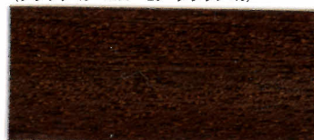
65-19 ウォールナット (ブラック 30・レッド 10・ブラウン 60)