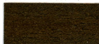
65-17 ダークオーク (ブラック 40・エロー 20・ブラウン 40)