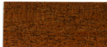
65-13 チェリー (ブラック 10・エロー 10・ブラウン 80)