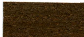
65-15 ライトオーク (ブラック 30・エロー 10・ブラウン 60)