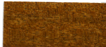
65-11 チーク (ブラック 10・エロー 40・ブラウン 50)