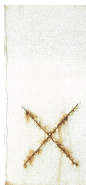
ワイドさびストップ