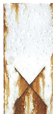
1液形さび止め塗料