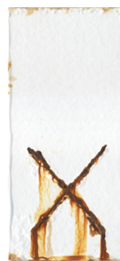
2液形さび止め塗料