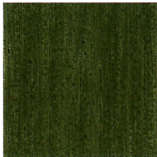
729 ファークグリーン