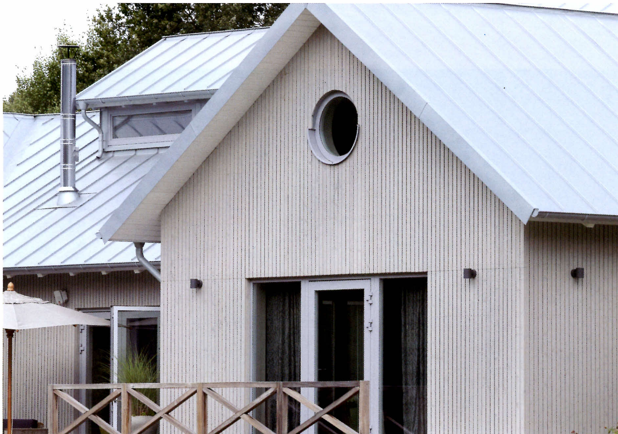
施工例：外壁に#906パールグレー2回塗り