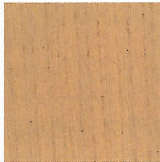
733 ヘムロックファー