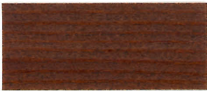
▲ #103 チーク(2回塗り)