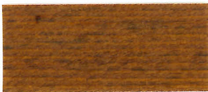
▲ #110 オリーブ(2回塗り)