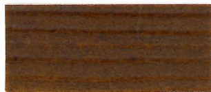
▲ #111 ウォルナット(2回塗り)