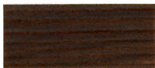
▲ #108 ブラウン(2回塗り)