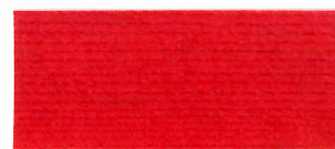
▲ #117 レッド(2回塗り)