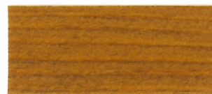
▲ #115 スプルース(2回塗り)