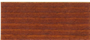
▲ #107 マホガニ(2回塗り)