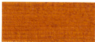
▲ #102 メープル(2回塗り)