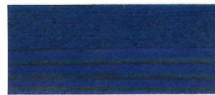
▲ #118 ブルー(2回塗り)