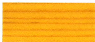
▲ #116 エロー(2回塗り)