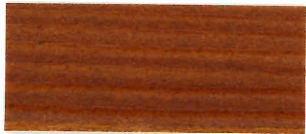
▲ #105 チェスナット(2回塗り)