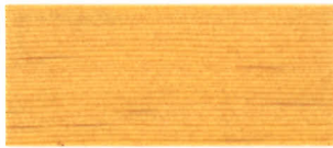
▲ #120 白木(2回塗り)