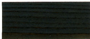
▲ #112 ブラック(2回塗り)