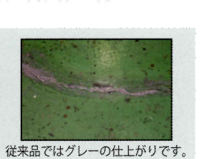
従来品ではグレーの仕上がりです。