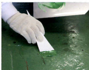
ゴムベラやパテベラ等で欠損部に塗り込んで修正します。