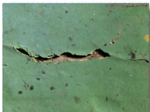
下地のゴミやホコリ・浮き塗膜など取り除き、十分に乾燥させます。