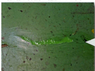
はみ出た材料を取り除き、ならして完成です。