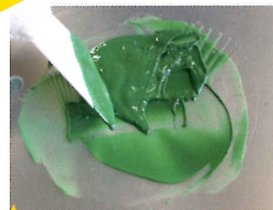
均一な緑色になるまで混ぜます。