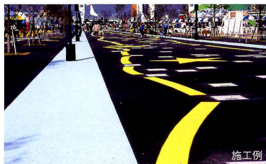
塗装色は#80ホワイト (黄色は指定色)

※日塗工色見本には無いため色見本を掲載します。 ※この色見本は印刷物のため実際の色調とは多少異なります。 標準色の指定・選定・ご注文は必ず別冊の標準カラーサンプルをお願いします。